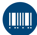
Código de barras