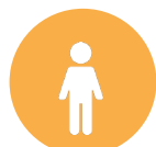
Sensor de cuerpo