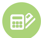
Dispositivo PIN Pad