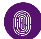
Lector de huellas